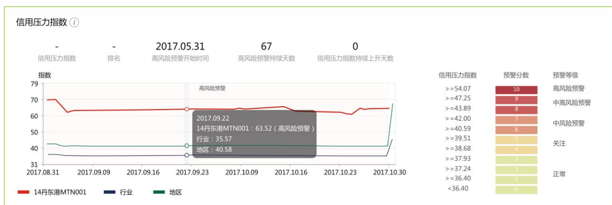
德勤智慧债券预警页面截图 - 14丹东港MTN001

丹东港在政府默许助力下大兴举债扩张策略，银行券商也未能重视其高风险特征限制融资，举新债偿旧债成为资金链条维系模式。从其2017年5月起开始发布大量资产抵押公告可知，丹东港集团在违约前数月已意识到自身资金流动紧张，但筹措规划仍无法挽回流动性恶化趋势。随之，八月中旬又发布法定代表人变动公告。至此，丹东港虽未发布风险提示公告，但违约风险端倪已现。“14丹东港MTN001”在德勤智慧债券预警中信用压力指数已一路上升至70.13，高风险预警持续67天，最终于2017年10月30日无力回天，引起债市震动。